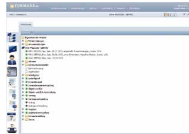
Der Aktenbaum: Zentrale Navigationsstelle innerhalb einer Beratung

Die FORMAXX AG hat sich das Ziel gesetzt, einen Maßstab für die Qualität in der Finanzberatung zu setzen. Das Geschäftsmodell basiert auf der Überzeugung, dass es für