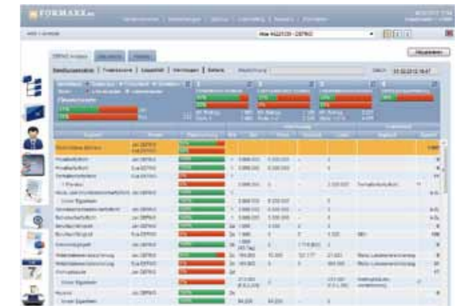
Die DEFINO-Analyse: Visualisierung der priorisierten Handlungsempfehlungen auf Basis der individuellen Kundenbedürfnisse

jeden Kunden in seiner persönlichen Situation immer nur ein für ihn maßgeschneidertes objektives Ergebnis gibt, unabhängig vom Berater und vom Standort. Um dieses Ziel zu erreichen, arbeiten die Finanzberater seit März 2011 flächendeckend nach dem Regelwerk der Deutschen Finanznorm (DEFINO). DEFINO führt den Kunden wissenschaftlich fundiert auf Basis von Prioritäten und Normen stufenweise über die Bereiche Absicherung, Vorsorge und Vermögensoptimierung zu seiner individuellen Finanzplanung. Hierfür ist eine detaillierte Erfassung der Kundendaten erforderlich. Diese schließt nicht nur Personendaten, sondern auch Ziele und Wünsche, bestehende Absicherungen und Risiken, Vermögenswerte, Verbindlichkeiten sowie Einnahmen und Ausgaben ein. Die auf die Bedürfnisse des Kunden zugeschnittene Beratung mit detaillierten Produktempfehlungen erfolgt nach dem Beratungsprinzip „SICHER SEIN“ und der „Gold-Silber-Bronze Logik“ (für den Bereich Absicherung und Vorsorge) beziehungsweise der „Best-in-Class Logik“ (für den Bereich Investment) von FORMAXX. Das aggregierte Ergebnis der Beratung nach DEFINO wird in einer einzigen Maßzahl